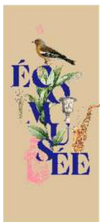
LA FERME DU CHAMP BRESSAN - ROMENAY